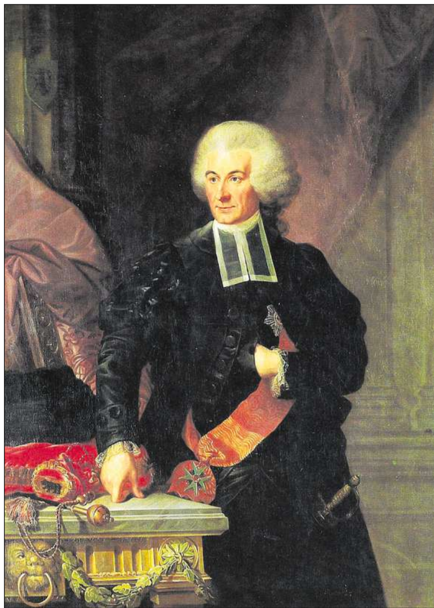
Niklaus Friedrich von Steiger, il davos president da la regenza da la Republica da Berna. (Maletg dal 1792)

La tendenza politica vers ina concentraziun da la pussanza è sa manifestada er en la relaziun tranter um e dunna. Lur rollas en vegnidas normadas; ina litteratura caracterisada d'ideals cristians, la «litteratura dals babs da famiglia», propagava dapi il 17avel tschientaner in maletg da la famiglia che correspundeva strusch a la realitad. Conjugal avevan da viver ensem en amur vicendaivla, avevan da fumar ina cuminanza dals bains e da trair si cuminaivlamain lur uffants. Sco chau da la famiglia valeva l'um che dueva, grazia a sia raschunavladad, diriger dunna ed uffants. Vers la consorta demussava el pazienza, essend ch'ella appartegneva per motivs morals ed intellectuels a la «schlattaina flaiivla». En realitad vegniva il mingadi da la famiglia dentant determinà da las diras relaziuns economicas. La rait sociala aveva anzas fitg largias. Tgi che crudava tras era dependent d'almosnas e da